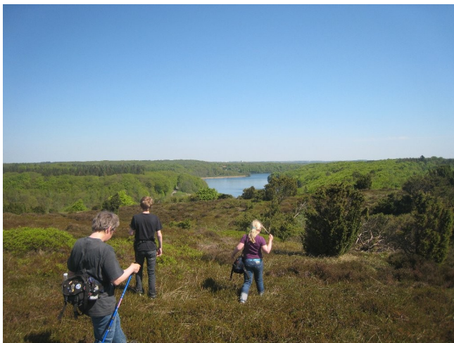
For mange geocachere er naturoplevelserne det vigtigste, billede taget af Eli Christensen

I cachen findes der som minimum en logbog, men i de større caches ligger der også små ting af ringe værdi. Det kan f.eks. være et hårelastik, en hoppebold, et stearinlys eller en legetøjsbil. Hvis man har lyst, må man bytte en ting fra cachen for en ting af samme værdi. Cachen er med andre ord ikke rigtig noget værd, men børn synes det er rigtig spændende at bytte.