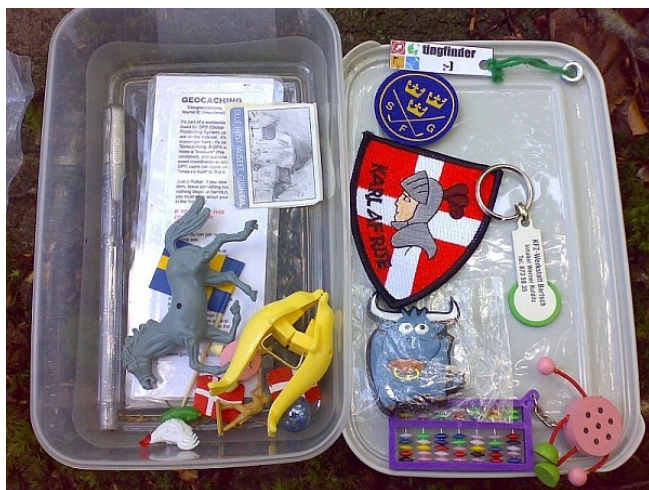
En cache med bytteting, billede taget af Anne Sandsgaard.

Cacher findes i mange former og størrelser. De mindste er ikke mere end 1*1 cm og bruges typisk i byområder. Så er der filmhylstre, som ofte bruges i byer og ved kirker. De fleste caches i naturen er enten Tupperwarebøtter eller gamle ammunicionsbokse, der er overmalede og mærket med at de er geocaches.