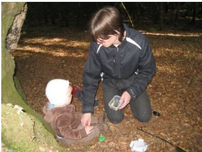
Geocaching er for alle aldre.

Du kan læse mere på den officielle hjemmeside http://www.geocaching.com eller på den danske hjemmeside http://www.geocaching.dk .