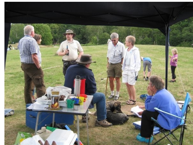
Geocaching er også hygge med venner

Den første tid efter en cache er blevet oprettet kommer der ofte lidt flere besøgende, ligesom der også er lidt sæsonudsving.